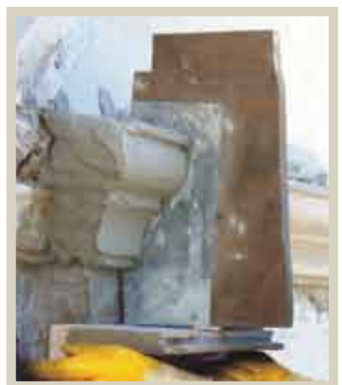
Tirage au gabarit. Chapelle Madeleine (73). Entreprise : Ateliers du Paysage.