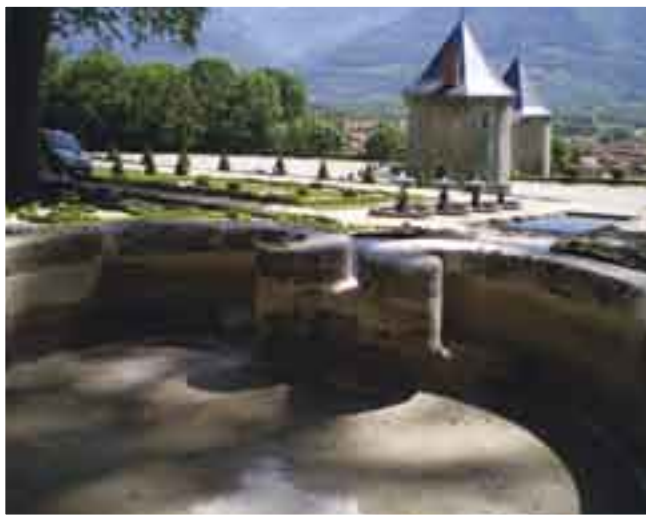
Château du Touvet (38). Entreprise : Combiel. Architecte : M. Tillier.