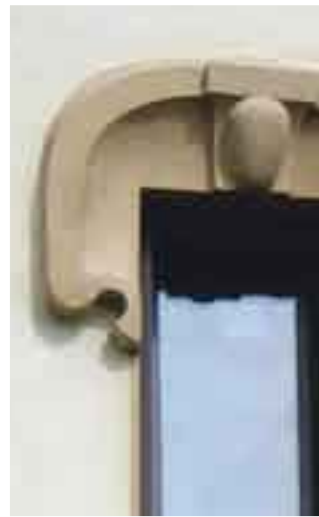
Détail de décor d'une maison à Yseron (69). Entreprise : Ateliers du Paysage.