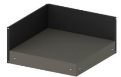
MOD1570 Plateau d'angle avec 2 crédences