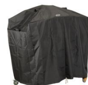
HCI080 Housse pour Modulo