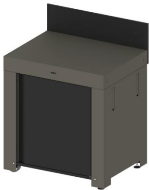
MOD7001 / PMOD7001 (kit) Module de base avec porte et crédence

Prolongez la maison avec la cuisine d'extérieur pour aménager un espace où vous aurez tout sous la main pour parfaitement cuisiner à la plancha. Les modules outdoor se choisissent séparément et se combinent en toute harmonie