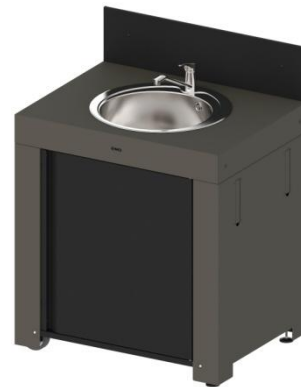
MOD7003 / PMOD7003 (kit) Module avec évier et robinet, porte et crédence