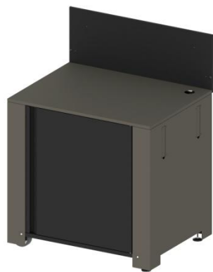
MOD7002 / PMOD7002 (kit) Module pour plancha avec porte et crédence