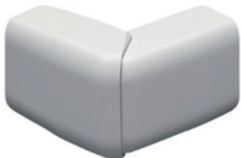
Angle extérieur variable 12x20 blanc