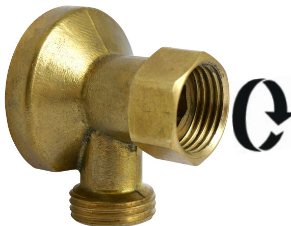
VERSION BRUTE POUR LE BÂTIMENT