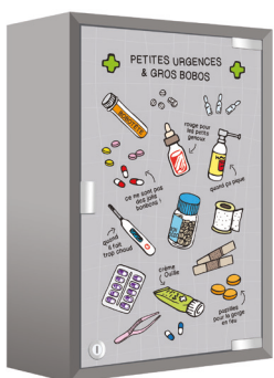
Armoire petites urgences