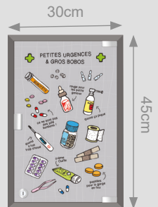
Armoire petites urgences