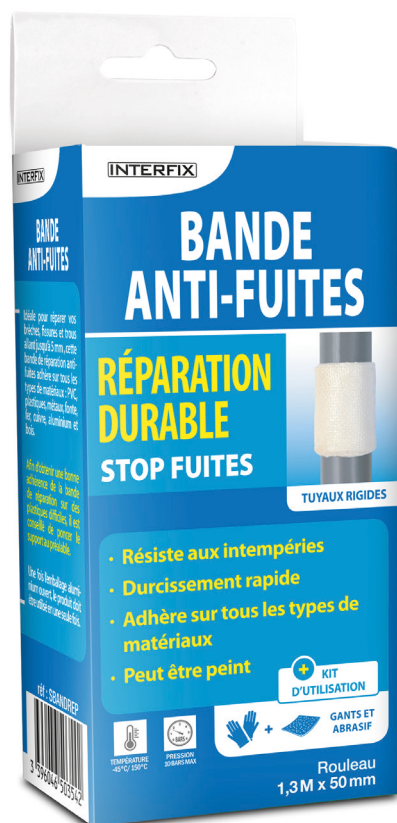
Boîte brochable (notice au dos)