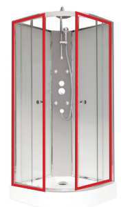
3/4 Porte vitrée