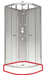
1/4 Receveur + accessoires