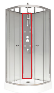
2/4 Panneau de fonctions