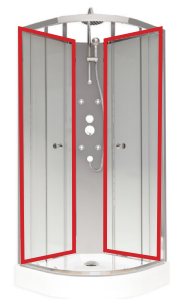
4/4 Panneaux arrière