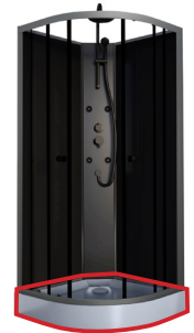
1/4 Receveur + accessoires