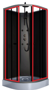
3/4 Porte vitrée