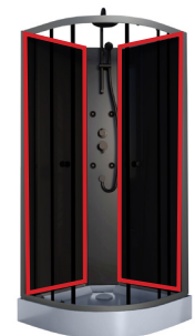
4/4 Panneaux arrière