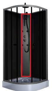
2/4 Panneau de fonctions