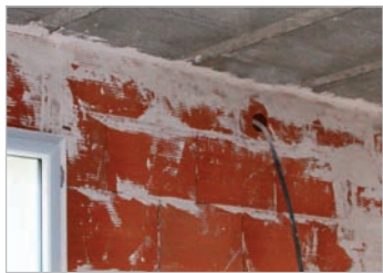
Tous matériaux All materials