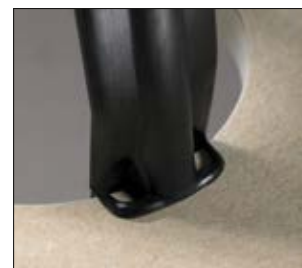
Des ailettes d'appui assurent la stabilité de l'ensemble.