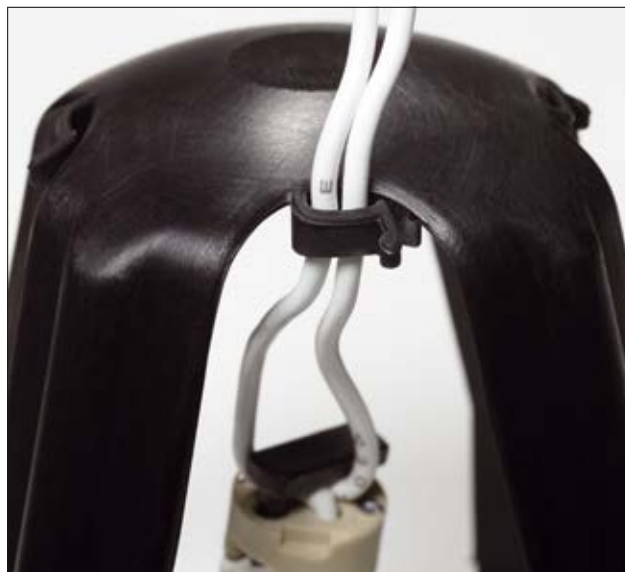
Les pattes de fixation de câbles sur la partie supérieure maintiennent le fil d'alimentation de la lampe.