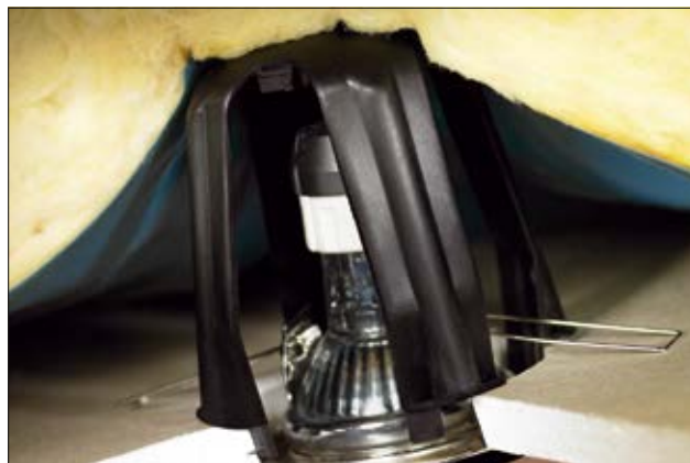
SpotClip-I assure la fiabilité et la sécurité des installations d'éclairage.

SpotClip-I réduit les risques de dommages causés aux matériaux isolants par surchauffe ou accumulation de chaleur, tout en augmentant potentiellement la durée de vie des ampoules.