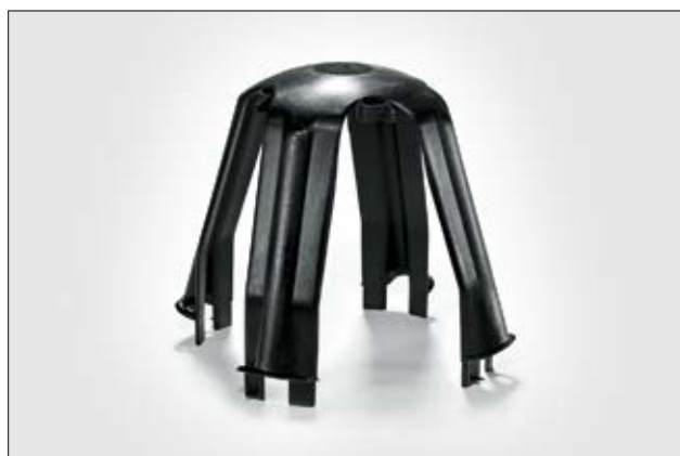
SpotClip-I - Support protecteur de spot à 4 pieds.