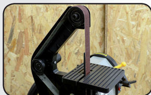
Changement rapide de bande Quick blade release