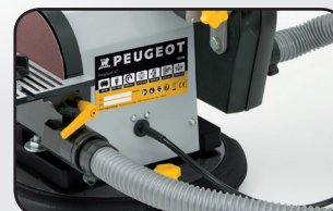
2 buses d'évacuation des poussières 2 Dust collector nozzles