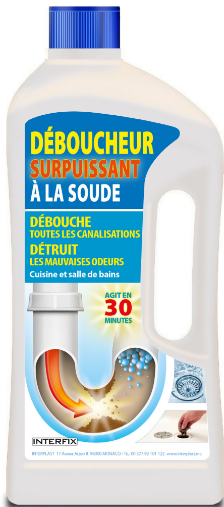
Bouteille de 1L (notice d'utilisation au dos)