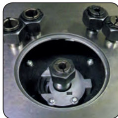
5 pinces de serrage (6- 6,35-8-12-12,7 mm)