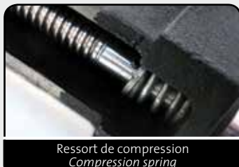
Ressort de compression Compression spring