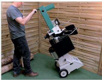
Transport facilité Easy to transport