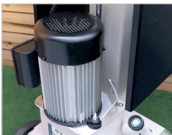
Moteur aluminium Aluminium motor