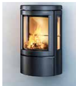
Bûches de 30 cm