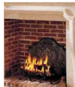
Bûches de 50 cm

Spécial cheminée, insert Special fire place