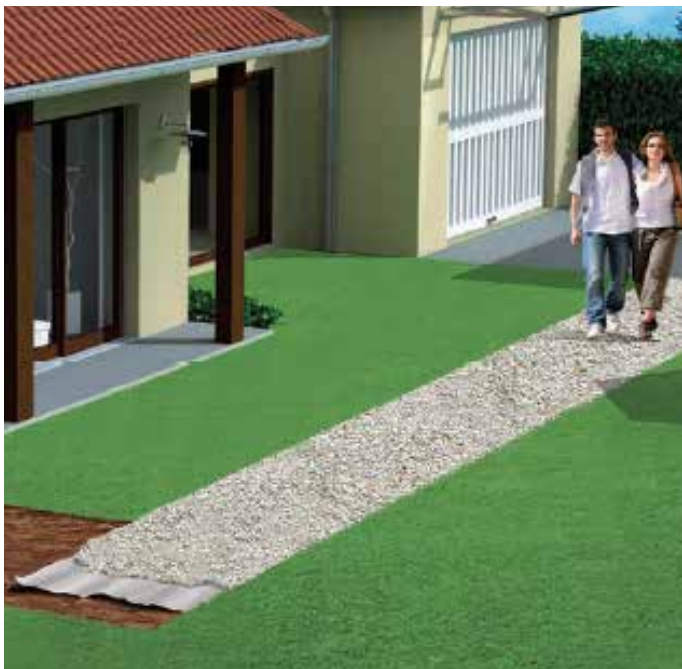
ALLÉES DE JARDIN