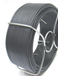
Fil d'attache Ligaplace