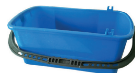
Bac de rinçage 10L