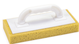
Taloche en mousse