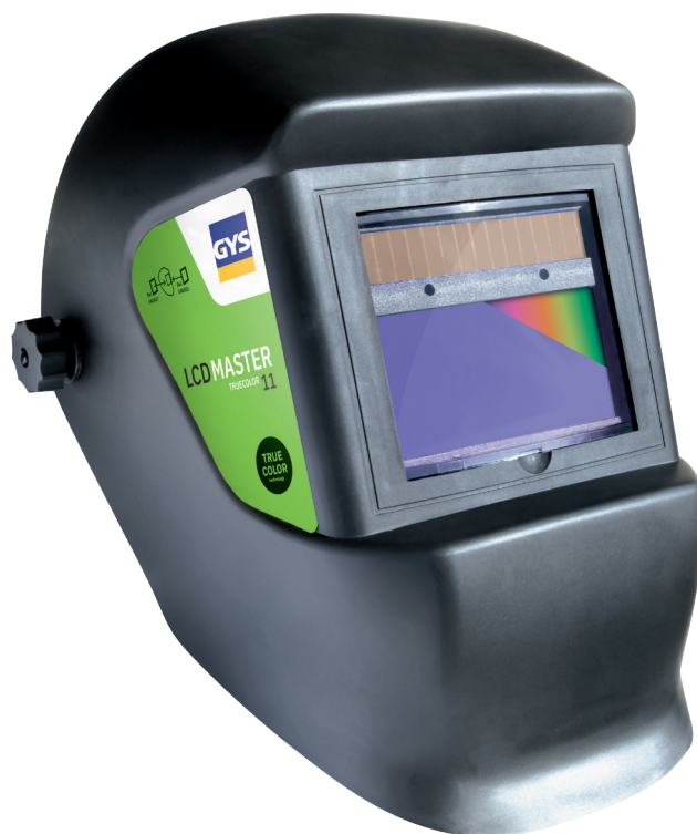
Livré avec un serre-tête