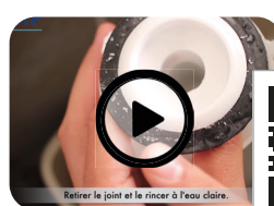
Maintenance clapet mécanisme SIAMP