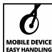
MOBILE DEVICE EASY HANDLING