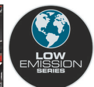
LOW EMISSION SERIES