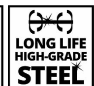
LONG LIFE HIGH-GRADE STEEL