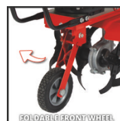
FOLDABLE FRONT WHEEL