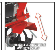
HEIGHT ADJUSTABLE DEPTH STOP