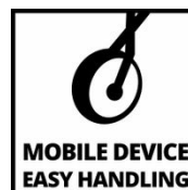
MOBILE DEVICE EASY HANDLING