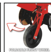
FOLDABLE FRONT WHEEL