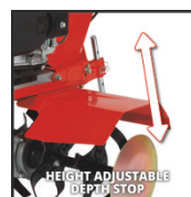
HEIGHT ADJUSTABLE DEPTH STOP