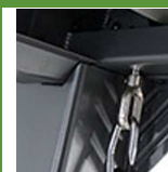
Zoom mécanisme d'ouverture