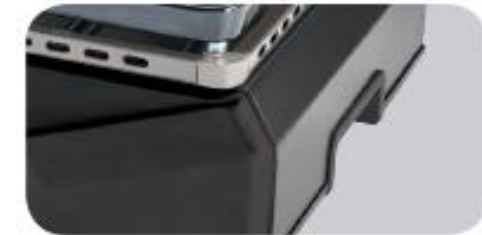
Poignées de transport latérales