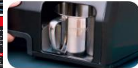
Récupérateur de graisse latéral Capacité: de la tasse : 45 cl