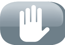
Arrêt de sécurité