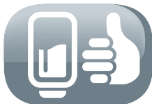
Ouverture main propre