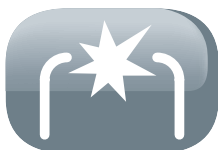
Allumage électrique Spark