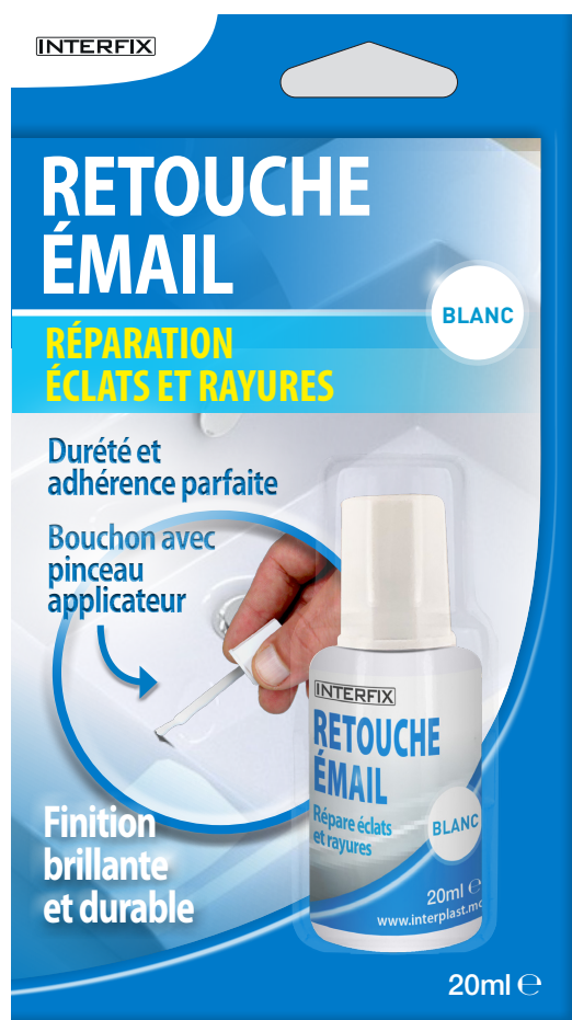
Blister plastique brochant (notice au dos)