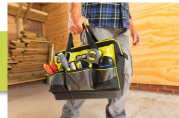
Poignées et sangles rembourrées pour plus de confort