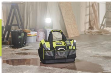
Base renforcée et imperméable à l'eau