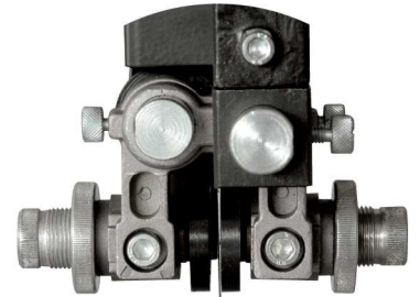
Guide de lame supérieur et inférieur à galets Upper and lower roller blade's guide