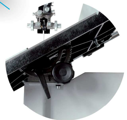
Table inclinable à 45° Bevel cuts up to 45°