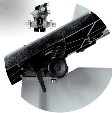
Table inclinable à 45° Bevel cuts up to 45°