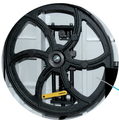
Volants en fonte d'acier équilibrés Cast iron wheels