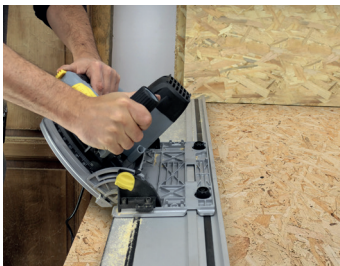
Inclinable 0-45° 0-45° Tilting blade

Livrée avec rail de guidage 1,65 m, 1 lame carbure 48 T montée, 2 étaux de fixation Delivered with 1,65 m guidance rail, 1 carbide blade 48 T mounted, 2 vices