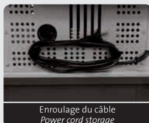
Enroulage du câble Power cord storage