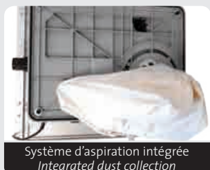
Système d'aspiration intégrée Integrated dust collection