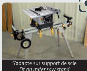
S'adapte sur support de scie Fit on miter saw stand