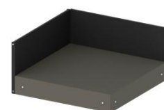
MOD1570 Plateau d'angle avec 2 crédences