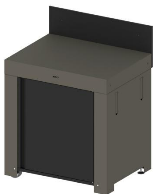
MOD7001 / PMOD7001 (kit) Module de base avec porte et crédence

Prolongez la maison avec la cuisine d'extérieur pour aménager un espace où vous aurez tout sous la main pour parfaitement cuisiner à la plancha. Les modules outdoor se choisissent séparément et se combinent en toute harmonie