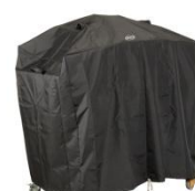
HCI080 Housse pour Modulo