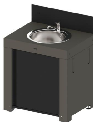
MOD7003 / PMOD7003 (kit) Module avec évier et robinet, porte et crédence