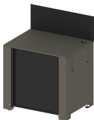
MOD7002 / PMOD7002 (kit) Module pour plancha avec porte et crédence