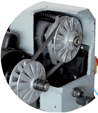
Moteur avec courroie Belt drive motor