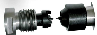
Alignement des pointes CM2 et broche d'entraînement filetée M33 x 3,5 mm CM2 headstock and threaded spindle drive M33x3,5