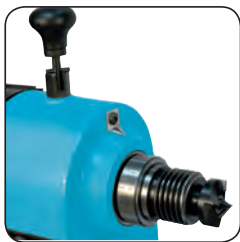
Diviseur 12 positions