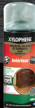
Aérosol de 400 ml