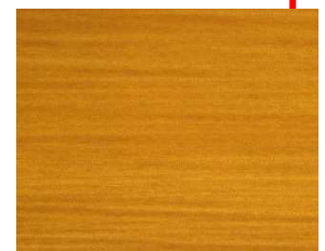
CHENE CLAIR SA-BI