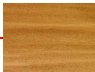
CHENE DORÉ SA-BI