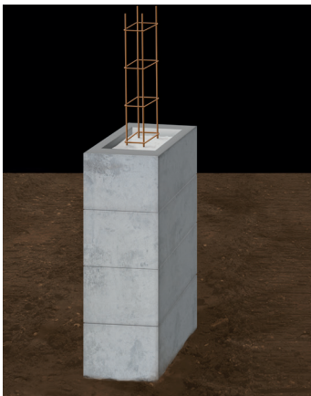
Remplissage de pilier Pillar filling